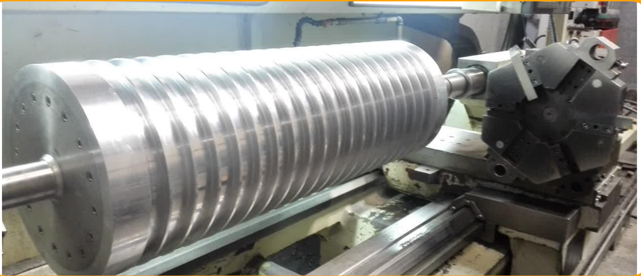
ساخت دستگاه نورد فرم کرکره ای