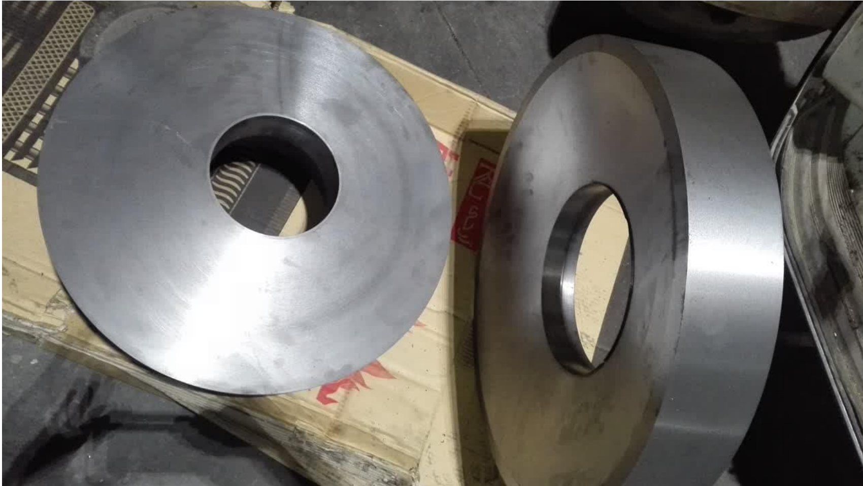
ماشینکاری و ساخت قالب پرس قطعه ای از دستگاه mover (ماشین آلات کشاورزی)