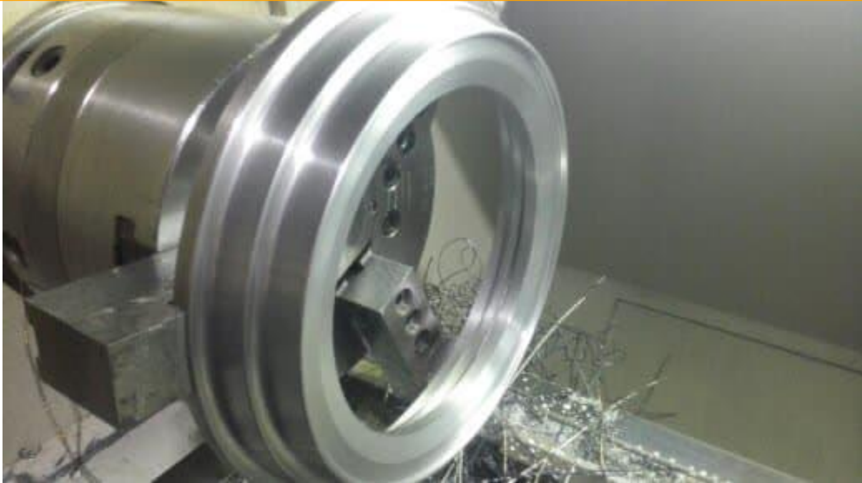
ساخت انواع قالبهای خطوط تولید لاستیک