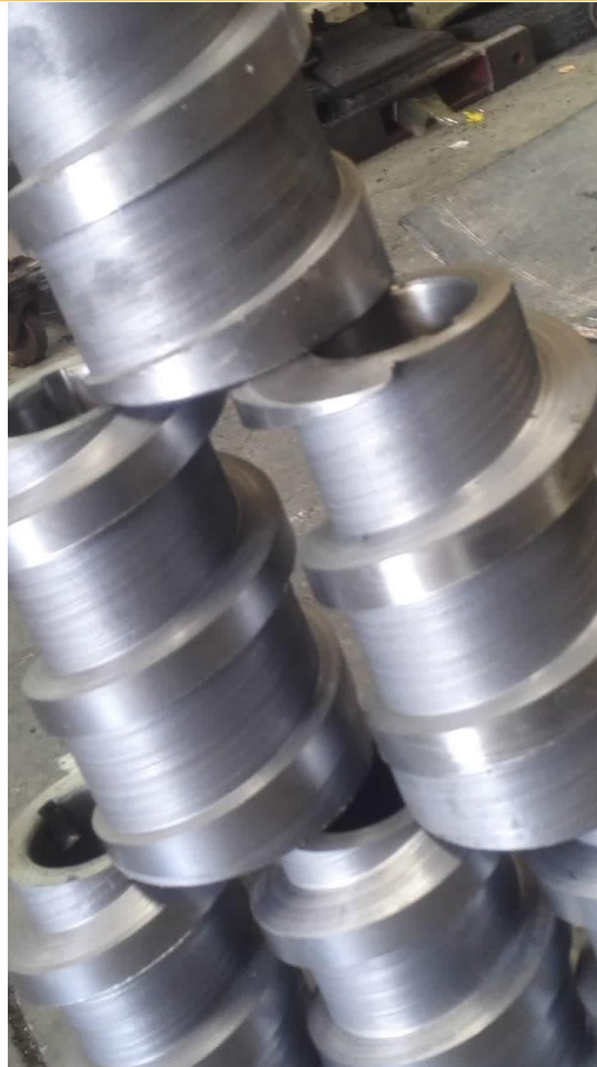
ماردونهای مخروطی دستگاه های روغن گیری از دانه های روغنی