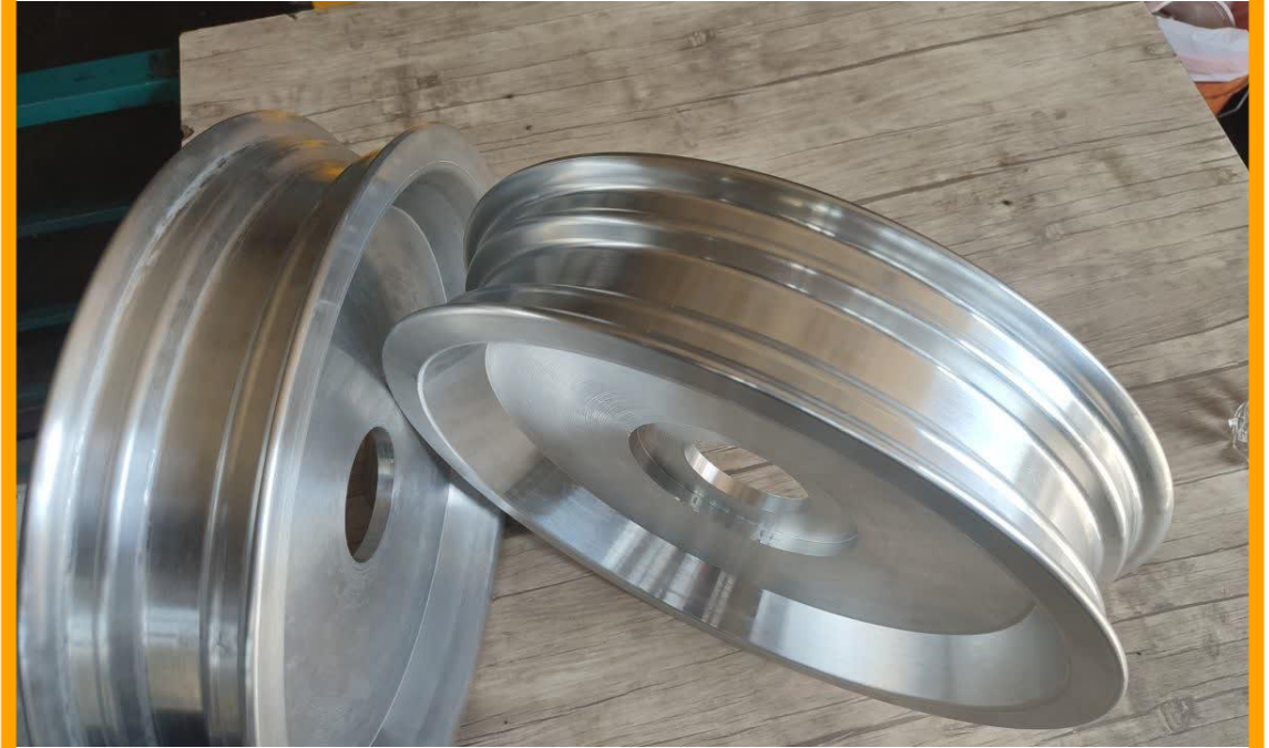
Test Rim صنایع لاستیک