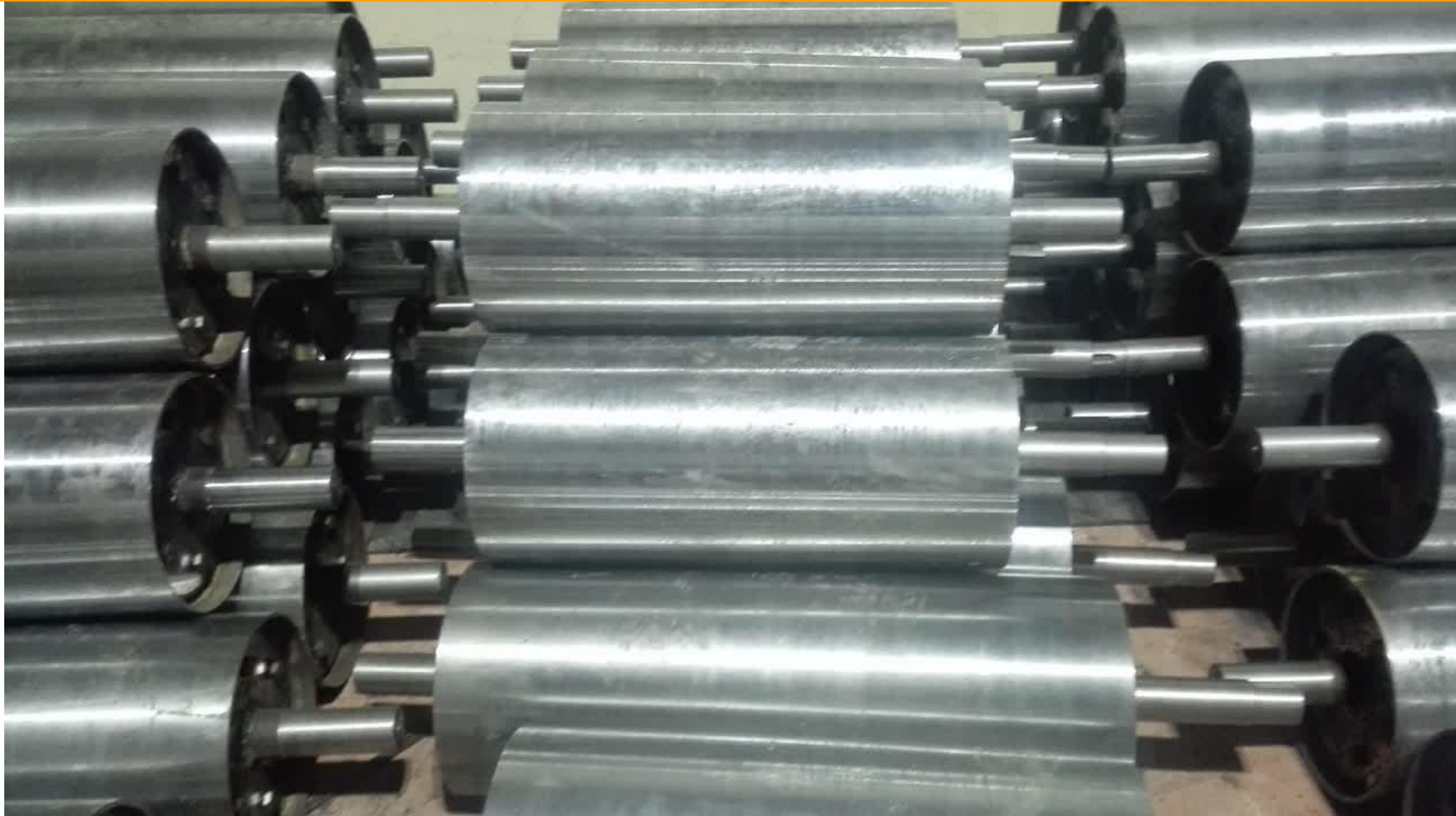
درام های میان مخروطی نوار نقاله شرکت های کاشی و گندله سازیها