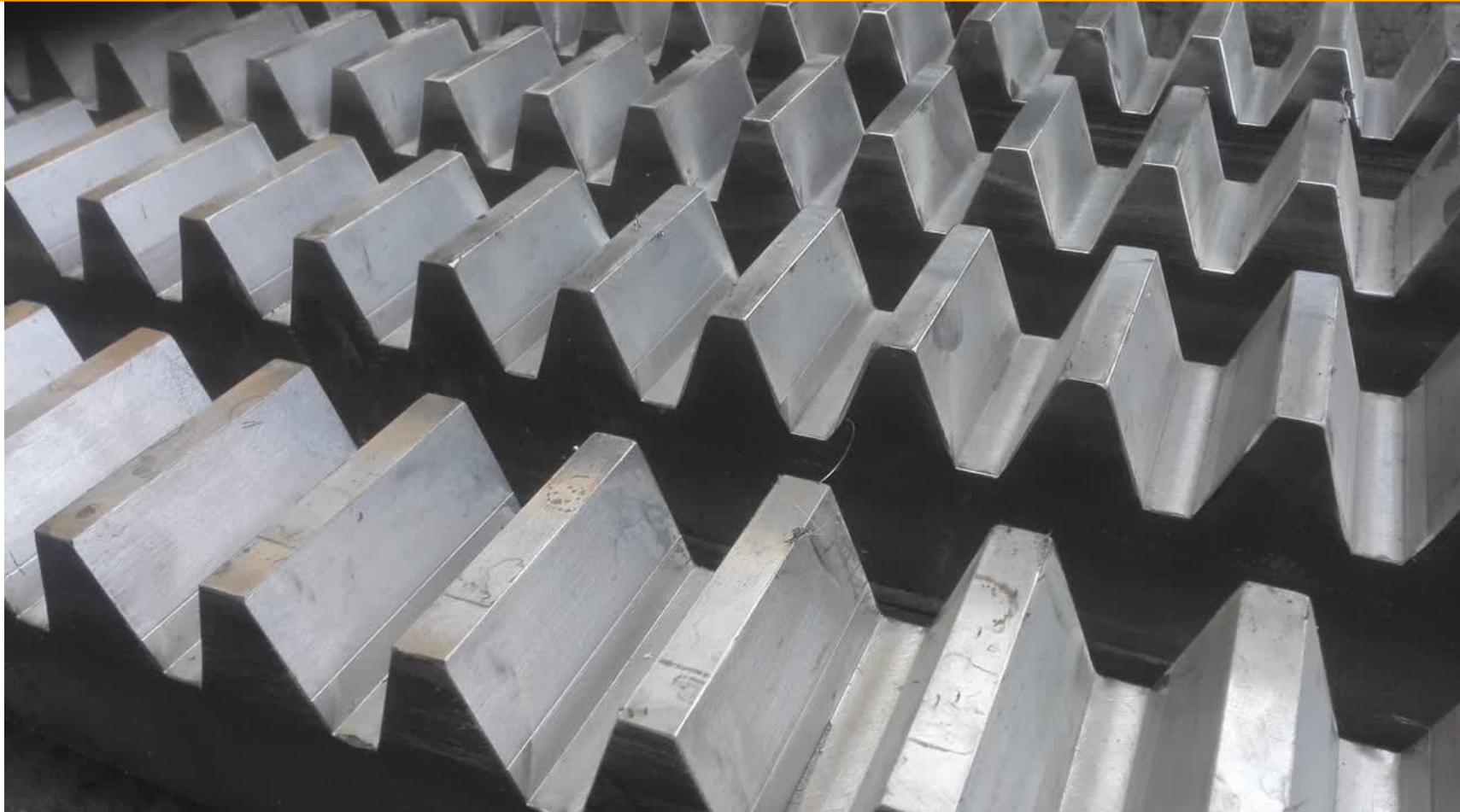
دنده شانه ای مربوط به خط گرم فولاد ارفع