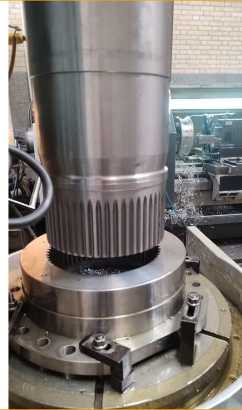
شفت جرثقیل 90 تن به سفارش کارخانه ذوب فولاد